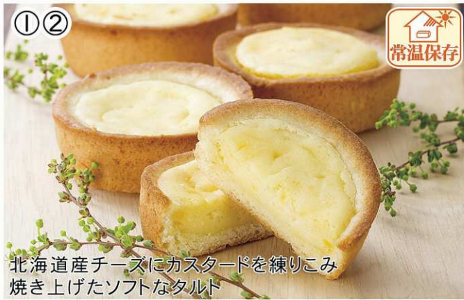
北海道産チーズにカスタードを練りこみ 焼き上げたソフトなタルト