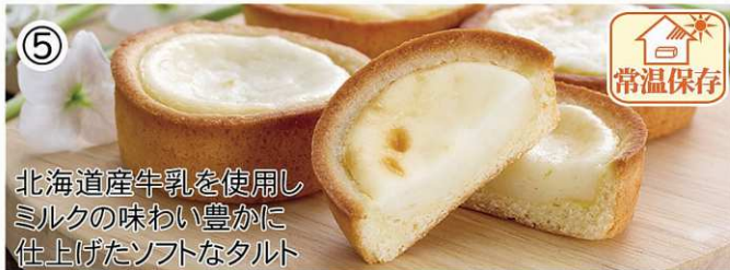
北海道産牛乳を使用し ミルクの味わい豊かに 仕上げたソフトなタルト