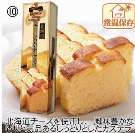
北海道チーズを使用し、風味豊かな 香りと気品あるしっとりとしたカステラ