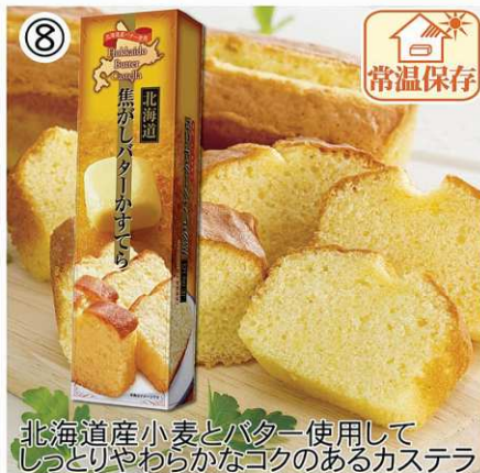
北海道産小麦とバターを使用して しっとりやわらかなコクのあるカステラ