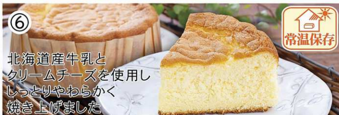
北海道産牛乳と クリームチーズを使用し しっとりやわらかく 焼き上げました