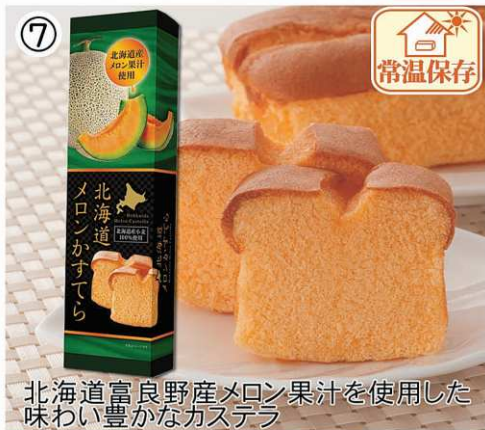
北海道富良野産メロン果汁を使用した 味わい豊かなカステラ