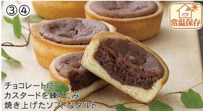
チョコレートに カスタードを練りこみ 焼き上げたソフトなタルト