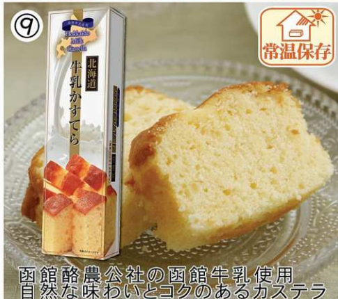
函館酪農公社の函館牛乳使用 自然な味わいとコクのあるカステラ